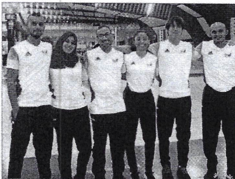
La compétition a été trop relevée pour les pongistes