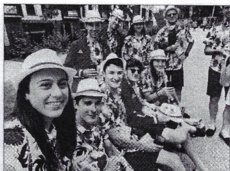
Les cyclistes et vététistes posant pour une photo souvenir en Angleterre