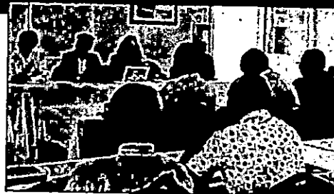
procédures d'urbanisme, l'adoption d'une approche spécifique du IWRM (Integrated Water Resources Management) pour Rodrigues et la planification et la mise en œuvre du schéma directeur.

Cernant le secteur de l'eau à Rodrigues, des plans stratégiques sont nécessaires concernant la collecte et la distribution d'eau, la mise en place des